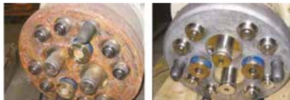
לפני ואחרי ציפוי בממיר VpCI-422

כממיר חלודה וכפרימר. ניתן להשתמש במוצר באזורים בהם קשה לבצע הכנת שטח נאותה או ניקוי חול; לשימושי תחזוקה תעשייתית; לטיפול במתכות באופן כללי; לטיפול במיכלי בסביבה ימית; לטיפול ביישום, מומלץ אחסון.